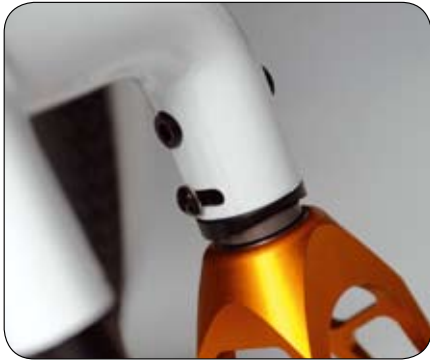
In hoek verstelbare voorvork met gepatenteerd mechanisme.