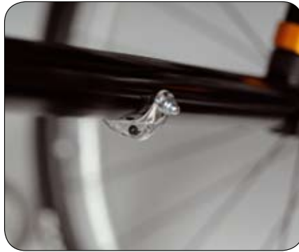
Visueel hulpmiddel voor een optimale uitlijning (toe in / toe out).