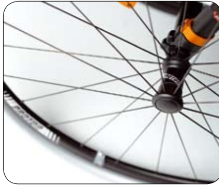
Proton Quick Release wielen.