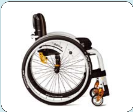
Met de Quickie Argon Helium is er een keuze uit een 88° en 80° frame.