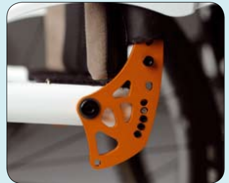
Innovatief lichtgewicht rughoekinstelling -31° tot +15°.