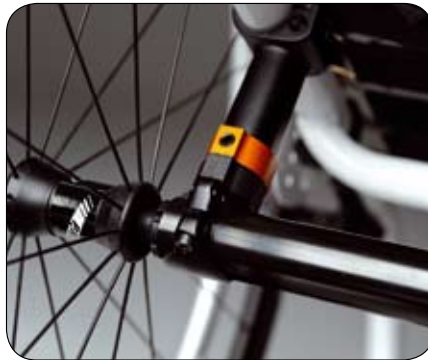
Vaste asplaat met zithoogte-instelling.