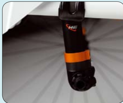
Snel, eenvoudig, licht en traploze zwaartepuntinstelling.