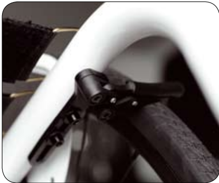
Ergonomische compacte schaarremmen.