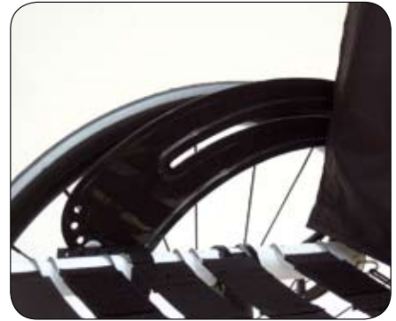
Een breed assortiment aan kledingbeschermers, zoals deze lichtgewicht carbon 'slim style' zijkant.