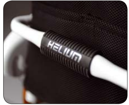
Ergonomische ovale handgreep.