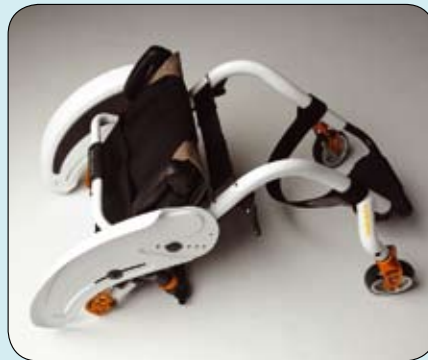
De Quickie Argon Helium met zijn innovatieve 'ovaal' gevormde frame.